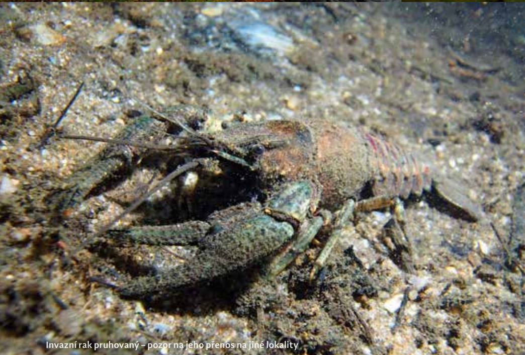
Invazní rak pruhovaný – pozor na jeho přenos na jiné lokality