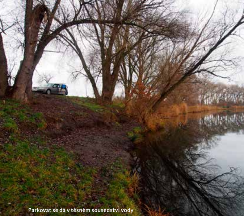
Parkovat se dá v těsném sousedství vody