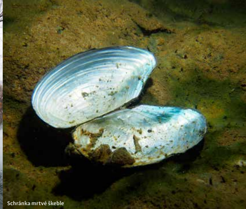
Schránka mrtvé škeble