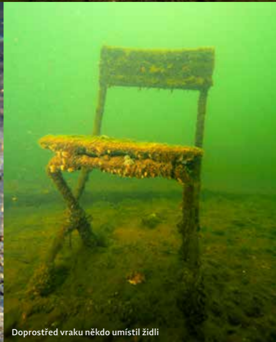
Doprostřed vraku někdo umístil židli

NEJBLIŽŠÍ PLNÍRNA: Manta Divers – Lubor Hubáček, Čechova 468, Mělník, tel.: 603 517 109, cena vzduch 8 Kč/litr, plnění možné jen po telefonické domluvě PARKOVÁNÍ: zdarma přímo u pískovny STRAVOVÁNÍ: přímo v místě ne, možno využít restaurace ve Staré Boleslavi, osobně se vždy stavuji v Hostinci Modrá hvězda, Boleslavská 728/19, kde vaří dobré lidovky PŘÍJEZD NA LOKALITU: ze Staré Boleslavi jedte směrem na Mělník, těsně před obcí Ovčáry odbočte z hlavní silnice doleva podél vody, po levé straně cesty se dá pohodlně zaparkovat